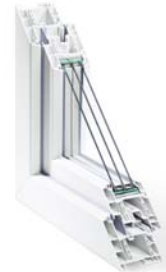
GENEO Lackierung außen möglich