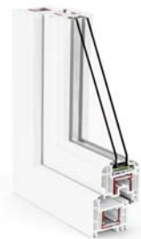
Brillant-Design Lackierung innen und außen möglich oder umseitig inkl. Glasfalz und Beschlagsnut (alle Sichtflächen)