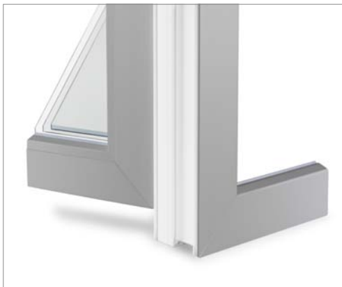
Lackierung außen und innen gleich