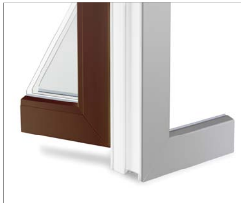
Lackierung außen und innen verschieden