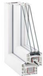
Euro-Design 86 plus Lackierung außen möglich