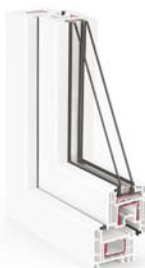
Euro-Design 70 Lackierung innen und außen möglich oder umseitig inkl. Glasfalz und Beschlagsnut (alle Sichtflächen)